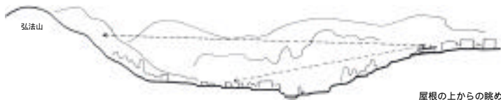
屋根の上からの眺め